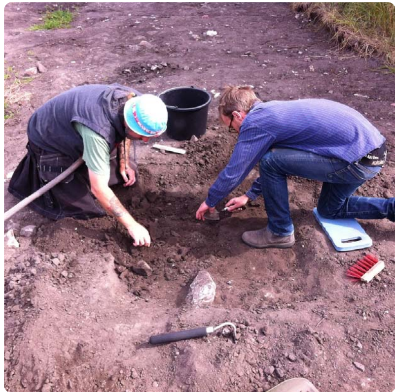
Publik arkeologisk undersökning.

Länsstyrelsen avgör hur stor del av den totala kostnaden som kan ges i bidrag. Det är alltid en fördel om projektet stöds av flera aktörer.