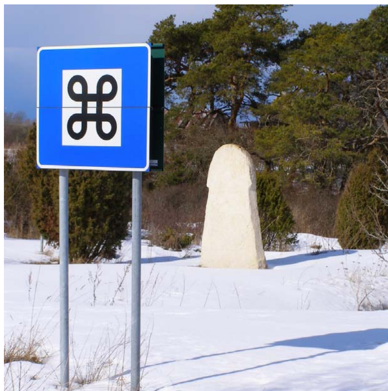
Visby och St Hans korset.