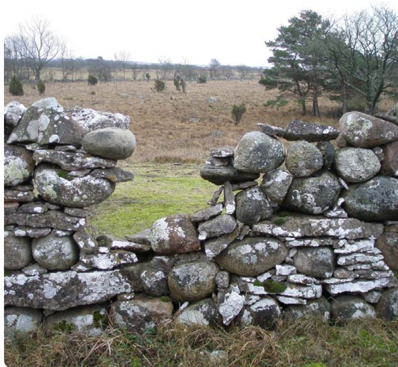
Stenvast, Storsudret